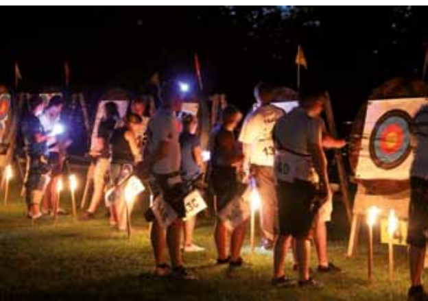
Fackelturnier auf den Reutenen