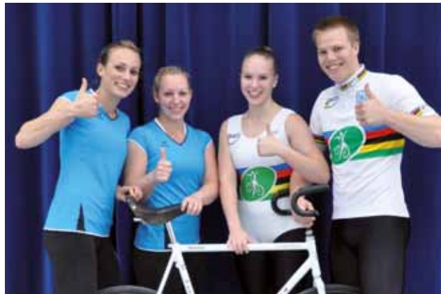
Aufgehts zur WM nach Basel

Gesamtverein: Die jährlichen Vereinsmeisterschaften und die Fun-Challenge erfreuen sich großem