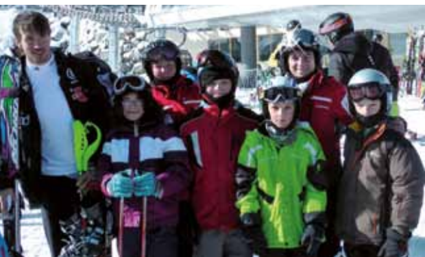
Skijugend unterwegs mit Felix Neureuther

Der SVM wurde im Jahre 1879 als Turnverein gegründet. Später kamen der Radverein und die Sportfreunde (Fußball) dazu. Nach 1945 wurde das Sportangebot nach und nach erweitert, so dass der SVM heute aus zwölf Abteilungen besteht und der größte Verein in Mergelstetten ist. Es wurden auch diverse Sportanlagen in eigener Regie gebaut. Die Sportanlage auf den Reutenen gehört im Kreis mit 3 Fußballplätzen, der Sporthalle, der Tennisanlage und der Gaststätte zu den schönsten und u.a. wurde die Zoeppritzhalle für den Sportbetrieb renoviert. Dies wurde maßgeblich in den letzten 40 Jahren durch die beiden Vorsitzenden Georg Mayer und Hans Althammer zu Wege gebracht. Sportlich kann